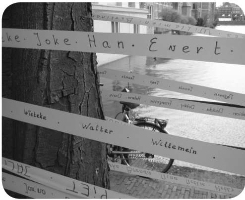
Oranje linten van de omsingeling van de regeringsgebouwen

Wilhelmus te beginnen met het "omsingelen" van de regeringsgebouwen met het oranje lint dat met namen van ongeboren kinderen beschreven was. Hiermee wilden we allen in de politiek oproepen een einde te maken aan het doden van kinderen in de moederschoot.