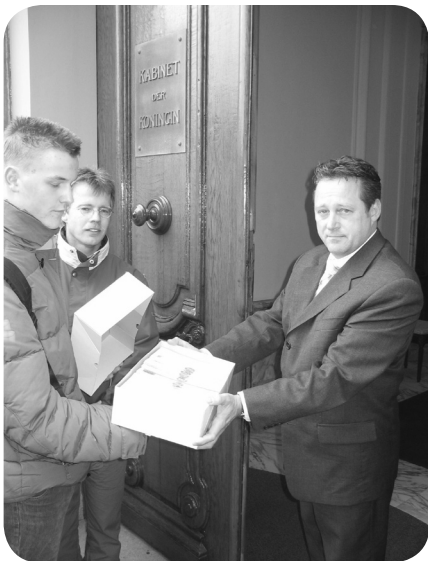
Aanbieding van de handtekeningen aan het Kabinet van de Koningin

Tijdens de "omsingeling" van de regeringsgebouwen