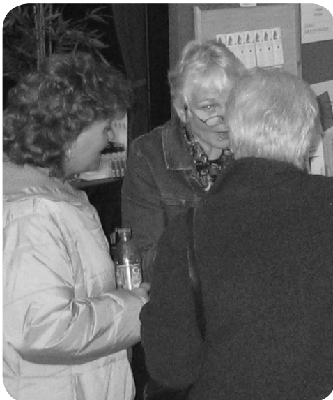
Gesprekken op de Huishoudbeurs

Als eerste kwam er een groep moslimmeisjes. Zij waren voor het vak "verzorging" naar de beurs gekomen. Toen ik hen de folder "Iedereen doet het, dus waarom jij niet?" wilde overhandigen, wilden zij er eerst niets van weten. De leerkracht vroeg hen echter even te blijven staan en zo namen zij deel aan