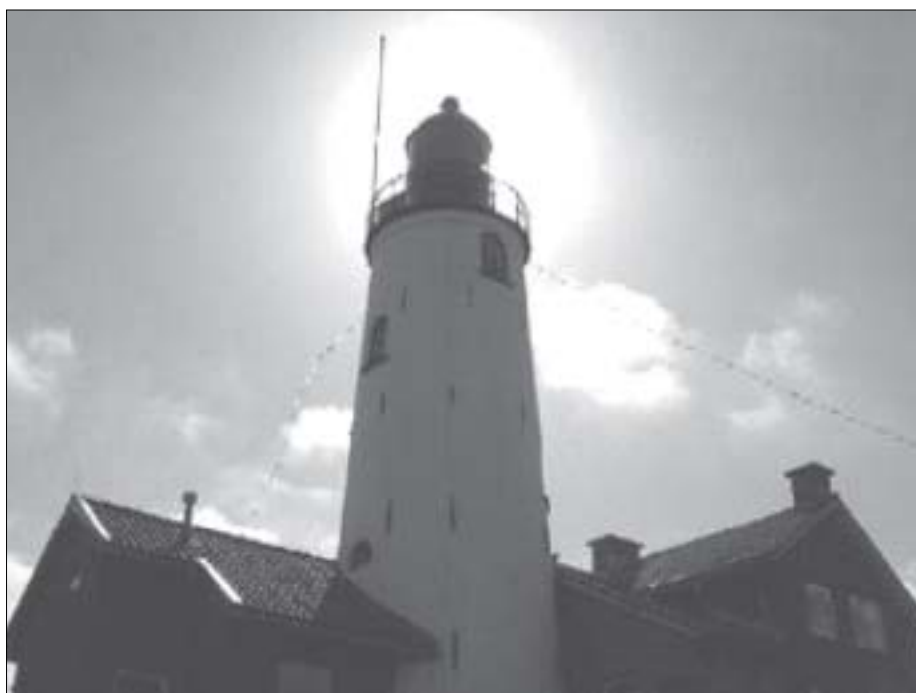
Vuurtoren Urk, een veilige baken in zee

Zoals de landelijke pers meer dan duidelijk heeft gemaakt is er ook op het christelijke Urk een drugsprobleem. Hongerige dealers hebben de enorme jeugd van Urk als afzetgebied ontdekt. Gelukkig vormt de nog steeds aanwezige sociale controle een belangrijke belemmering voor deze dealers. Op Urk is er nog steeds een sterke binding met elkaar. Dit komt ondermeer ook uit in de jaarlijkse Urkerdag. Dit is een dag die met, voor en door de Urkers zelf georganiseerd wordt. Oude gebruiken en klederdrachten komen die dag weer uit de kast. Stille trots om een rijk verleden op het eigen eiland.