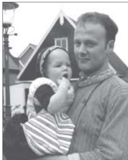
De jeugd is de toekomst

U moest eens weten wat een jongen van vijf dan al in zijn mars heeft, de hele occulte catechismus die hij ook kan toepassen! Dus antwoorden wij: "Als hij zeven jaar is, doet hij het zonder computer. En als hij een tiener wordt, zijn dieren niet meer voldoende." Daar keek zij dan wel even van op, en terecht! Meer hierover leest u in het Occult zakwoordenboek, zojuist in derde druk verschenen.