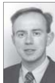
SGP Tweede Kamer: mr. C.G. van der Staaij

Elke eerste van de maand van 10.00 tot 12.00 uur staan wij voor een aantal abortusklinieken om te bidden en te spreken met de meisjes en vrouwen die naar binnen en naar buiten komen. Kinderen worden gered. Wij nodigen u uit om ook mee te doen. Bel ons tel. 035-6244352.