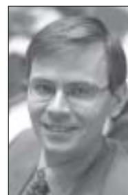
CU Tweede Kamer: mr. A. Rouvoet