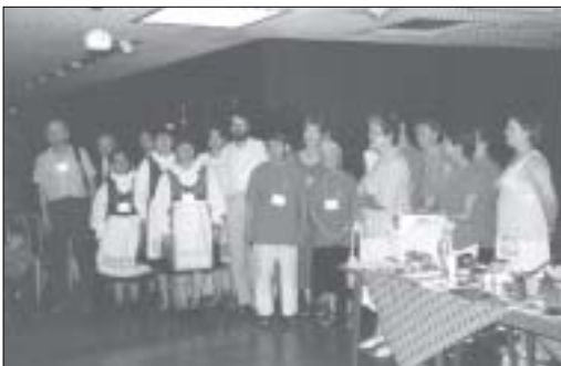
De Hongaarse groep tijdens de presentatie van de landen op de conferentie in Boedapest

Het ziet er dus niet rooskleurig uit in Europa. Het feit dat een aantal Oosteuropese landen, waaronder Polen, volgend jaar lid wordt van de Unie, geeft nieuwe mogelijkheden. Schreeuw om Leven was actief betrokken bij de organisatie van de pro-life conferentie in Boedapest in juli van dit jaar, waar jonge leiders uit Hongarije, Roemenië, Rusland en de Oekraïne bemoedigd en getraind werden. Schreeuw om Leven doet ook mee in een Europees pro-life overleg dat geregeld in Brussel bijeenkomt. Het is ons doel om de pro-life stem in Europa tijdens de Europese verkiezingen op 10 juni 2004 te versterken.